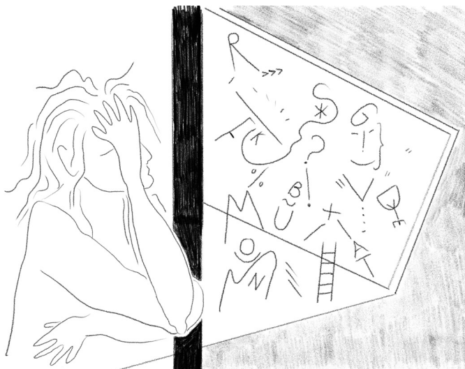
(eigen illustratie, 2021)

Is een van de oorzaken van de druk die ik ervaar als maker de verwachte doelstellingen vanuit de maatschappij?